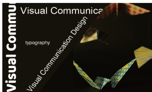
写真 × タイポグラフィ